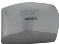
Encontrador forma americano BBSDA