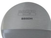
Encontrador forma de calcanhar BBSDH