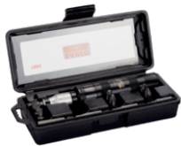
Conjunto com 30 bits e adaptador 7865