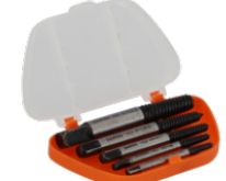
Conjunto de 5 peças de extratores de pernos 1435/5