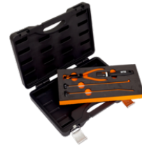
Molas de remoção e instalação de calços de travões BBR210P3