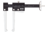
Paquímetro de alumínio BBR400