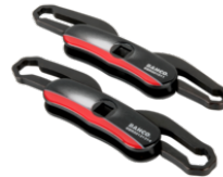
Chaves para casquilho de purga do travão para o 10 & 11 mm BBR501011