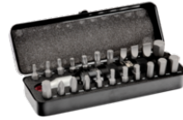
Conjunto sortido de bits para parafusos Phillips, fenda, hexagonais e TORX® 7823