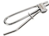
Braçadeiras para o circuito de travagem BBR150I