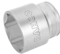
Chave de caixa, 6 faces 7800SM-27