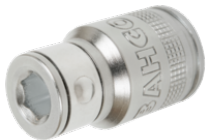
Adaptadores para chave quadrada 1/2" para pontas de chave de parafusos sextavadas 5/16"/40 mm 8174A