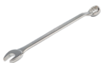
Chave mista offset 1952M-6