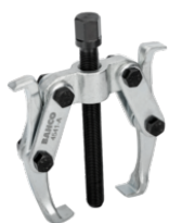
Extractor de dois braços 4541-A