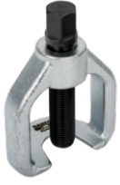
Saca esferas 4545-2