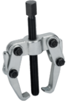
Extractor de três braços 4543-2