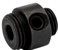
Adaptador para alargar furos existentes 3834-UPSIZE