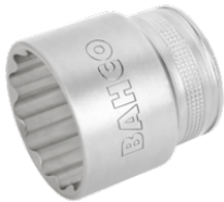
Chave de caixa, 12 faces 7800DM-15