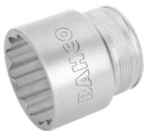
Chave de caixa, 12 faces 7800DM-19