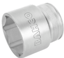
Chave de caixa, 6 faces 7800SM-27