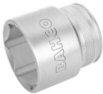
Chave de caixa, 6 faces 7800SM-20