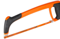
Armação de serrote para metais - profissional 319