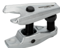
Saca esferas universal 4545-N2