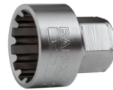
Chave de caixa de 19 mm com perfil estriado de 24 mm SBS19-TH24