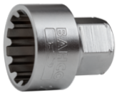
Chave de caixa de 19 mm com perfil estriado de 22 mm SBS19-TH22