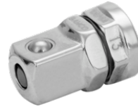
Adaptadores de chaves de caixa para chave de roquete 1RMA-19-1/4-SQ