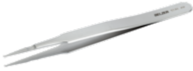
SMD-pinsett for plassering og lodding av 1 mm komponenter 120 mm 5546 AM