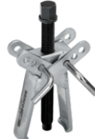
Avdrager av sakstype med galvanisert utførelse 70-85 mm 4614-1