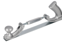
Portalimas de aluminio para hoja plana Pansar® 3-330 14" 9-462-14-0-0