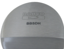
Tas Tacón BBSDH