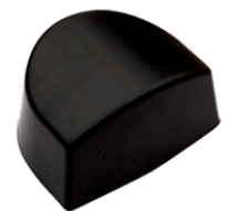
Tas de caucho para carroceros BBSDHR