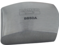
Tas americano BBSDA