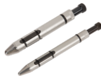
Mandriles de centrado para embragues SAC, 20-26,6 mm BE301CM-02