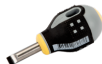
Destornillador de punta recta ERGO™ con mango de goma Stubby (1,2 x 6,5 x 25 mm) BE-8355