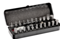
Juego de 23 puntas 1/4" para destornilladores a golpe para tornillos Phillips y TORX® de 45 mm x 70 mm x 197 mm 7823