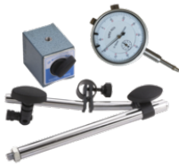
Comparador con soporte magnético 1154