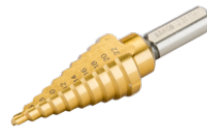
Broca escalonada para lámina de metal de 4 a 22 mm 229-SD