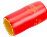
Vaso aislado VDE de 1/2", 13 mm 7800DMV-13