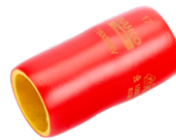
Vaso aislado VDE de 1/2", 19 mm 7800DMV-19