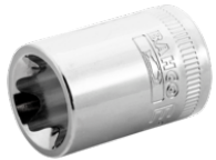
Vaso con cuadradillo de 3/8" y perfil TORX® E8 7400TORX-E8