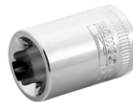
Vaso con cuadradillo de 3/8" y perfil TORX® E16 7400TORX-E16