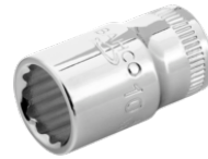
Vaso con cuadradillo de 1/4" con perfil bi-hexagonal de 5,5 mm A6700DM-5.5