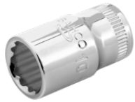
Vaso con cuadradillo de 1/4" con perfil bi-hexagonal de 5 mm A6700DM-5