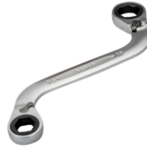
Llave doble de estrella plana a carraca en S de 14-19 mm con acabado cromado de 200 mm 1320SRM-14-19