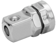
Adaptador para puntas y vasos con cuadradillo de 1/4" para llaves de carraca de 19 mm 1RMA-19-1/4-SQ