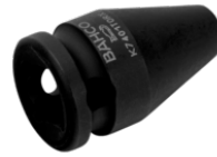
Vaso de impacto con cuadradillo de 3/8" con perfil de cabeza E7 TORX® y acabado fosfatado K7401TORX-E7