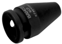
Vaso de impacto con cuadradillo de 3/8" con perfil de cabeza E8 TORX® y acabado fosfatado K7401TORX-E8