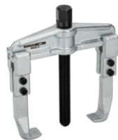
Extractor universal de dos garras con husillo templado por inducción y acabado galvanizado, 60-200 mm, 150 mm 4532-D