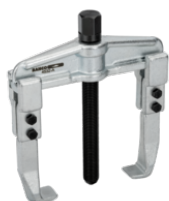
Extractor universal de dos garras con husillo templado por inducción y acabado galvanizado, 80-250 mm, 200 mm 4532-E