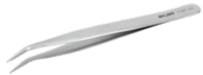
Pinzas SMD con puntas ranuradas en un ángulo de 30° SM115-SA de 120 mm 5589 AM